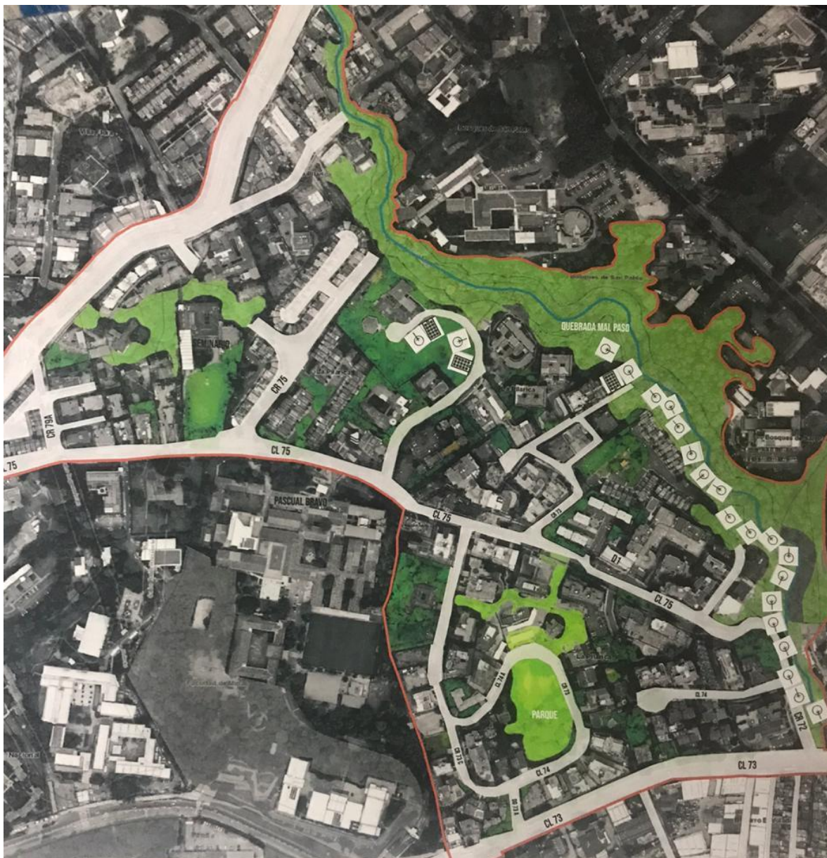
Mapa de la intervención de los funcionarios del Área Metropolitana del Valle de Aburrá