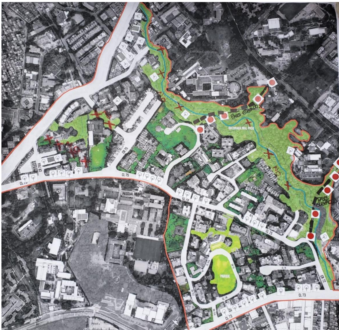
Mapa de la intervención de la secretaria de la Subsecretaria de Gestión y Control territorial